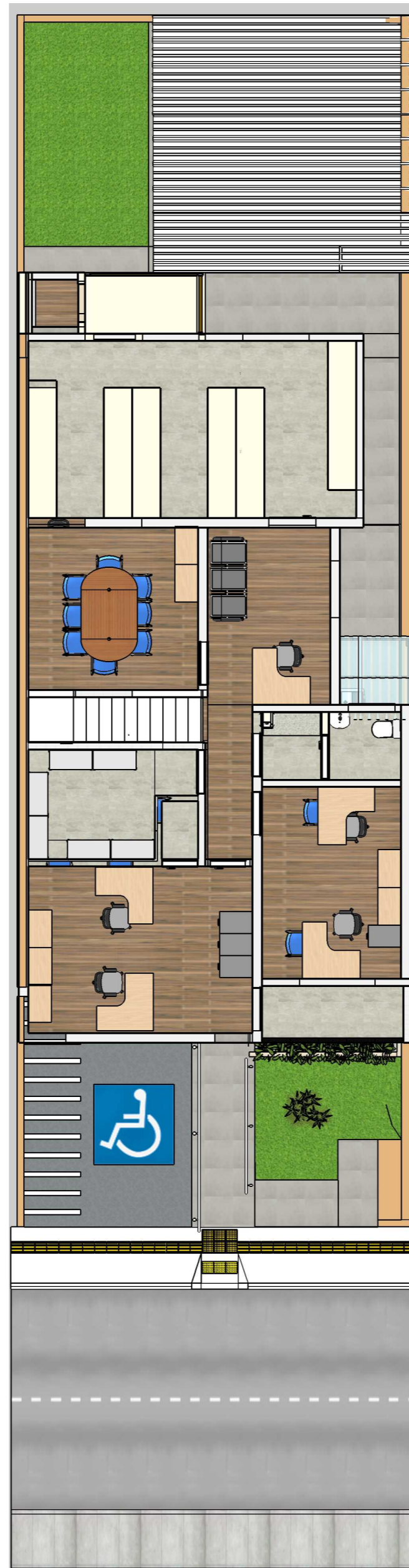
PLANTA PAVIMENTO SUPERIOR ESC: 1:100