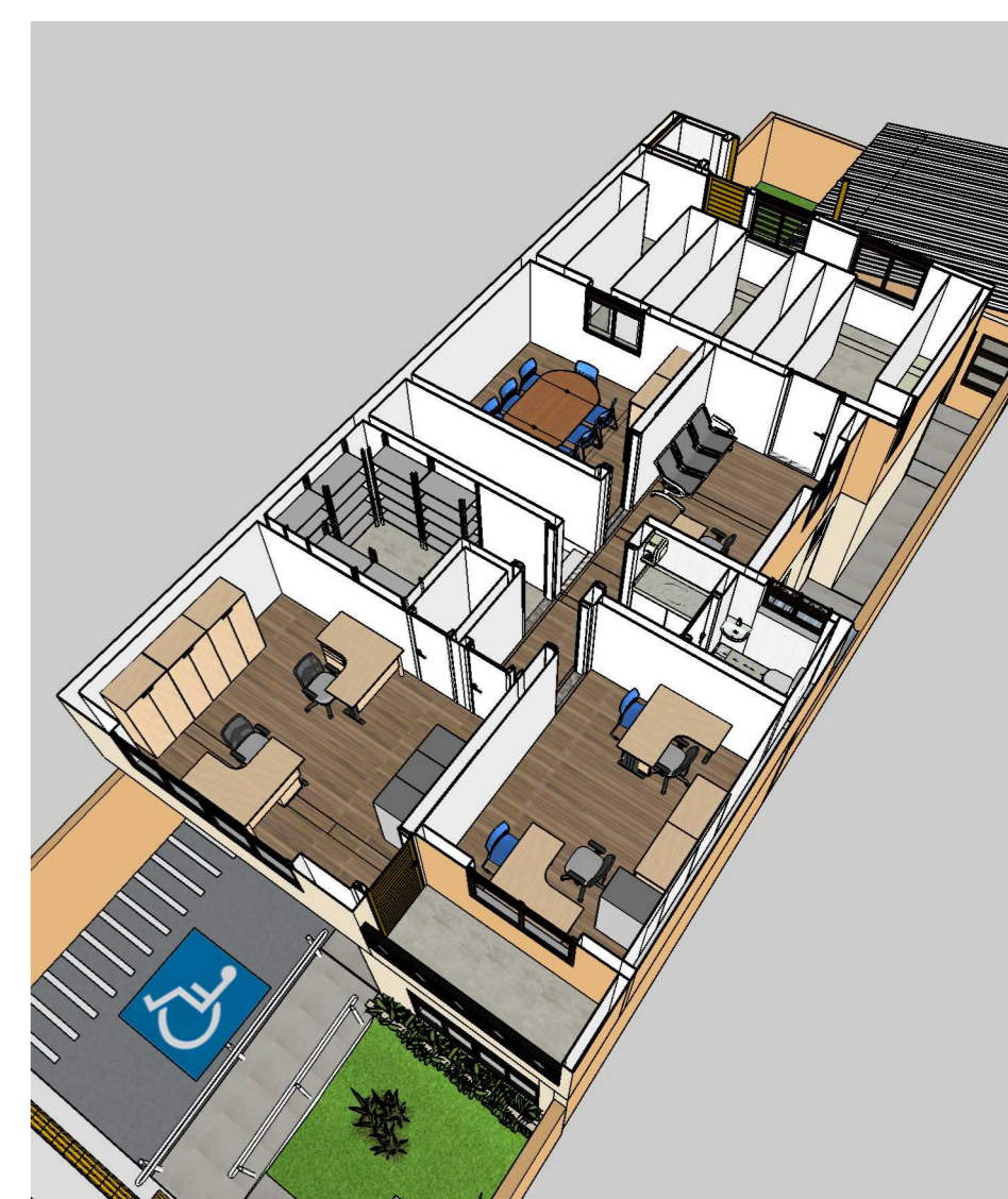
PERSPECTIVA PAVIMENTO SUPERIOR