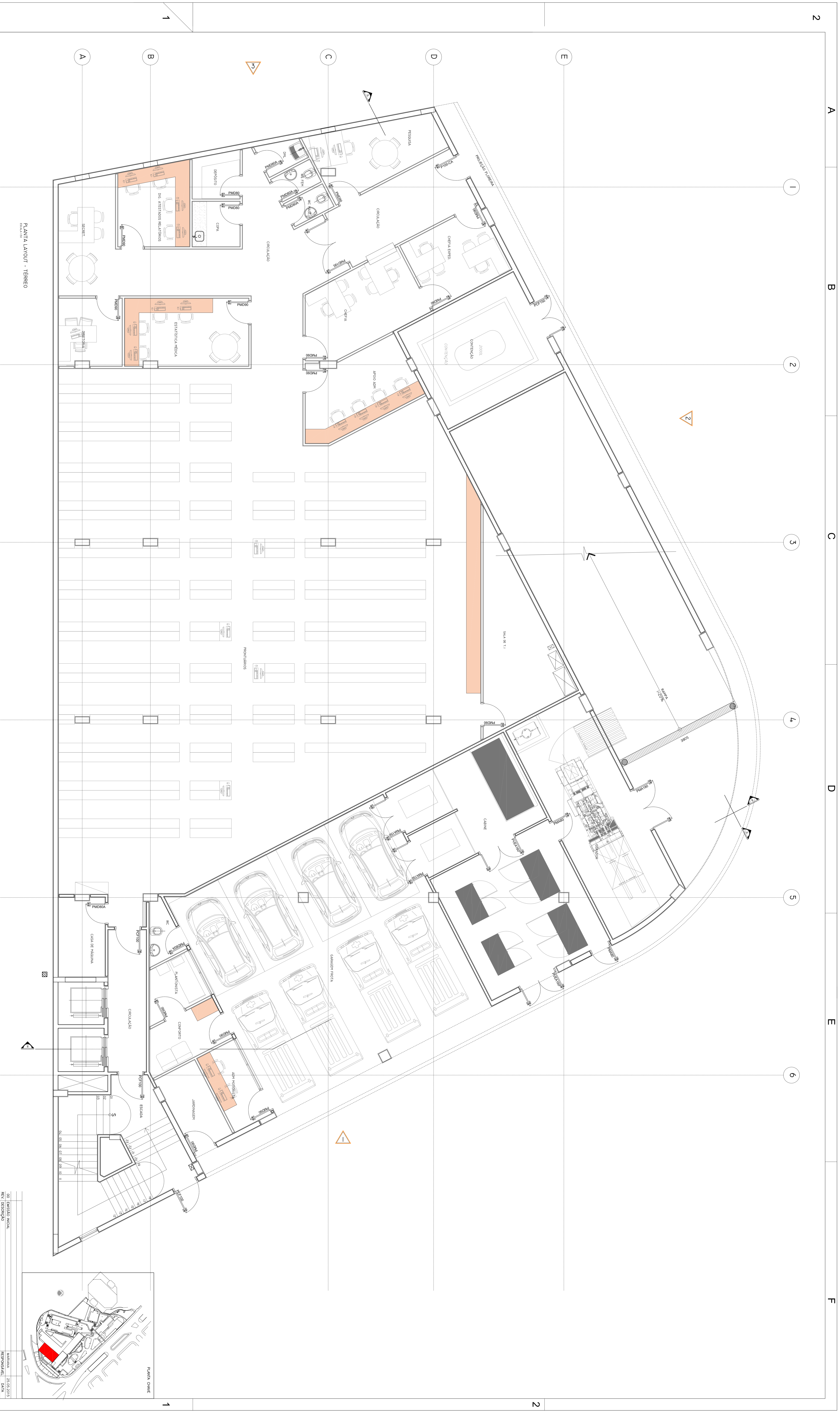
PLANTA LAYOUT - TÉRREO ESCALA 1:50