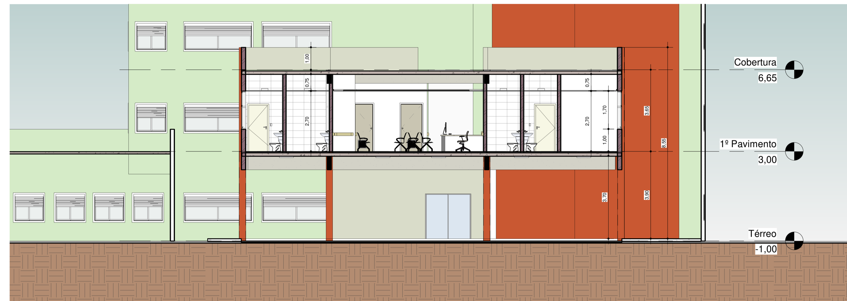
3 Corte A-A 1 : 100