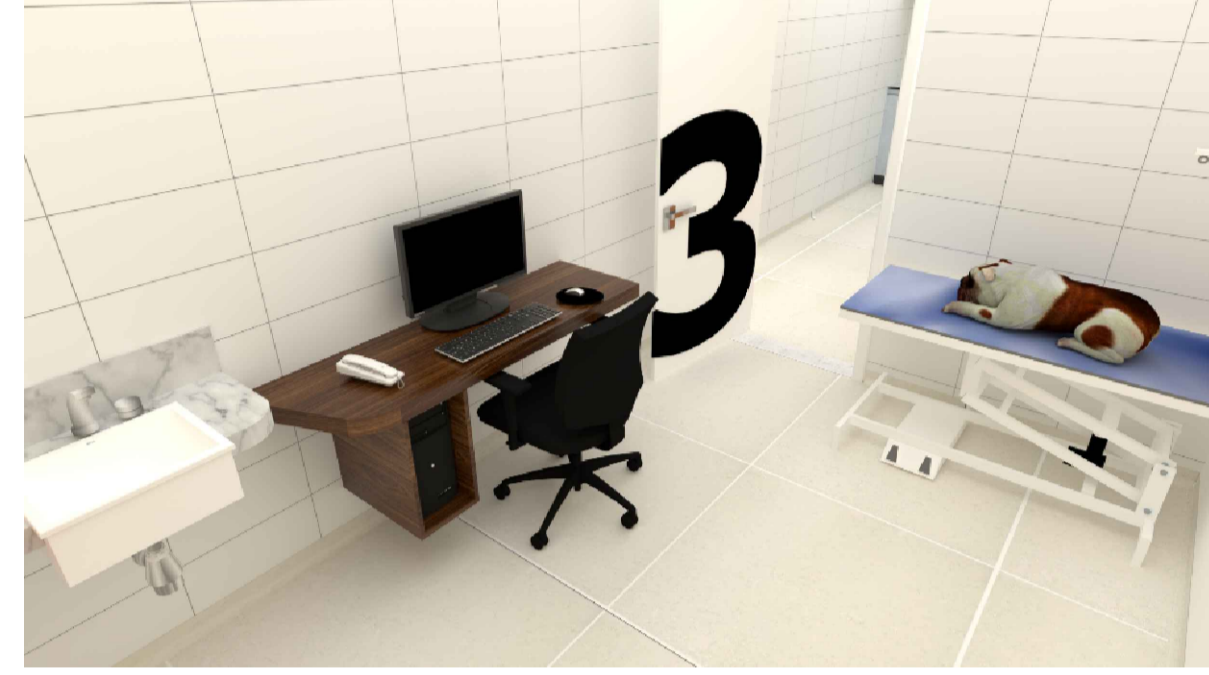
IMAGEM 01: CONSULTÓRIO