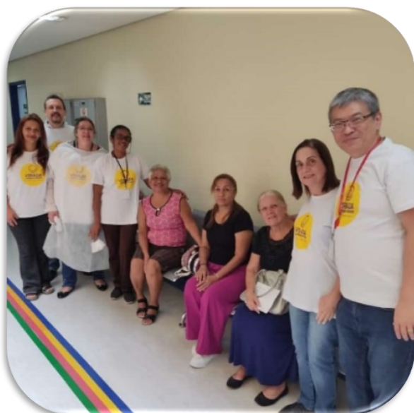
Ação de Saúde: Avaliação Bucal

ORGANIZAÇÃO: Gerência Especializada em Gerontologia