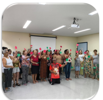
Oficina: Quis passa ou repassa Direitos da Pessoa Idosa