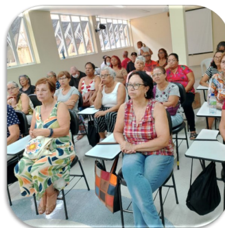
Oficina: Sabores com receitas cardioprotetoras