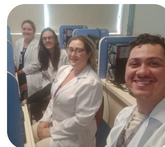
Hosp. Base—S. José Rio Preto