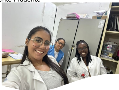
Santa Marcelina—Jd. Copa