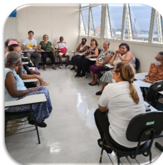
Oficina: Roda de Conversa