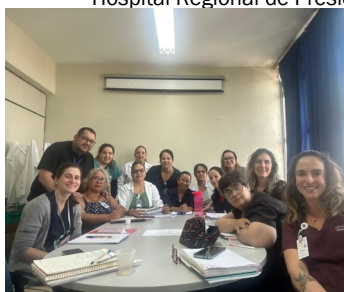
Hospital Municipal Diadema