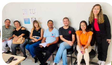
OSC OIAEU Mogi das Cruzes