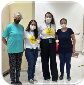
Ação de Saúde: Avaliação de Equilíbrio