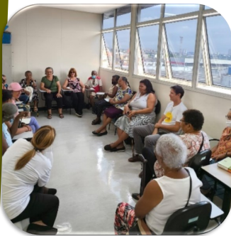
Oficina: O idoso e o seu protagonismo

O Instituto Paulista de Geriatria e Gerontologia “José Ermírio de Moraes” em parceria com a 5ª. Virada da Maturidade promoveu no dia 25/04/2024 o festival para aproximadamente 250 pessoas, ressaltando o protagonismo dos idosos, por meio de atividades gratuitas que celebram uma vida socialmente mais ativa, com qualidade, independência, conforto e segurança.