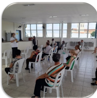
Atividade Física: Alongamento