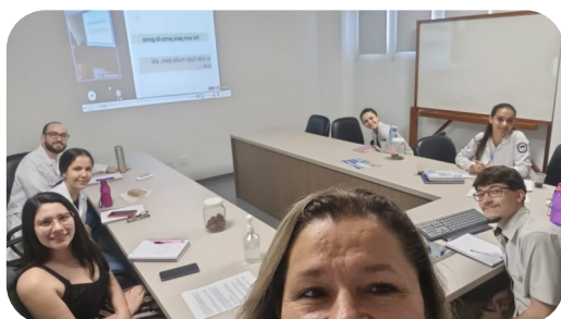
Hospital Regional de Presidente Prudente