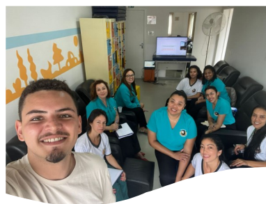
Centro Dio do Idoso—Mogi Cruzes