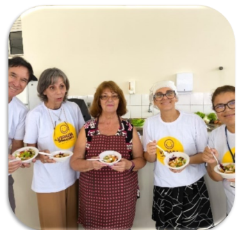
Oficina: Cozinha Saudável