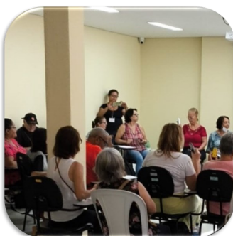
Oficina: Yura Ritmos