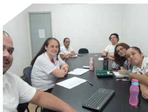
Centro Dia/SASF Unibes—SP