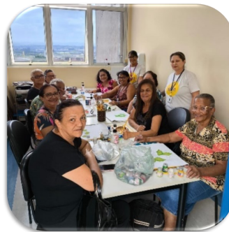
Oficina: Pintura em Tecido