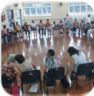
Atividade Física: Dança Sênior Sentada