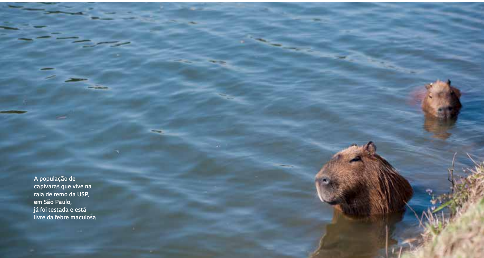
A população de capivaras que vive na raia de remo da USP, em São Paulo, já foi testada e está livre da febre maculosa

Do ponto de vista epidemiológico, não é possível dizer que as mortes ocorridas em junho na região de Campinas, no interior paulista, em consequência de infecções adquiridas em uma mesma fazenda, além de outros casos noticiados em seguida, estejam fora da norma. “Nos últimos